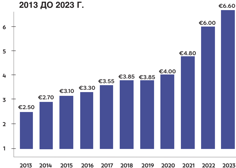
ИЗМЕНЕНИЕ НА ДИВИДЕНТА НА АКЦИЯ ОТ 2013 ДО 2023 Г.

По принцип дивидентът е част от нетните приходи на Групата, които по решение на Общото събрание се разпределят на акционерите.